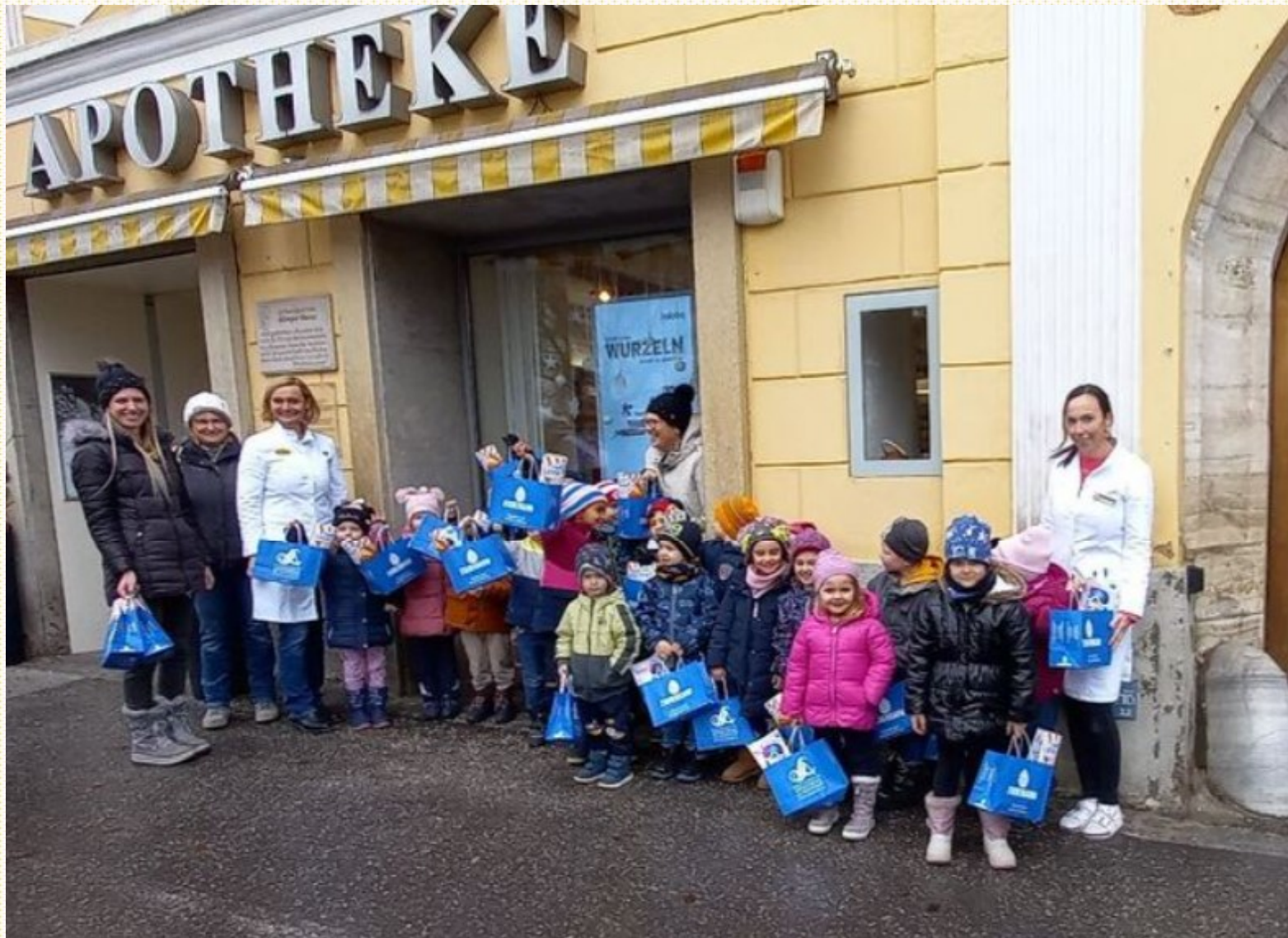
Besuch in der Apotheke