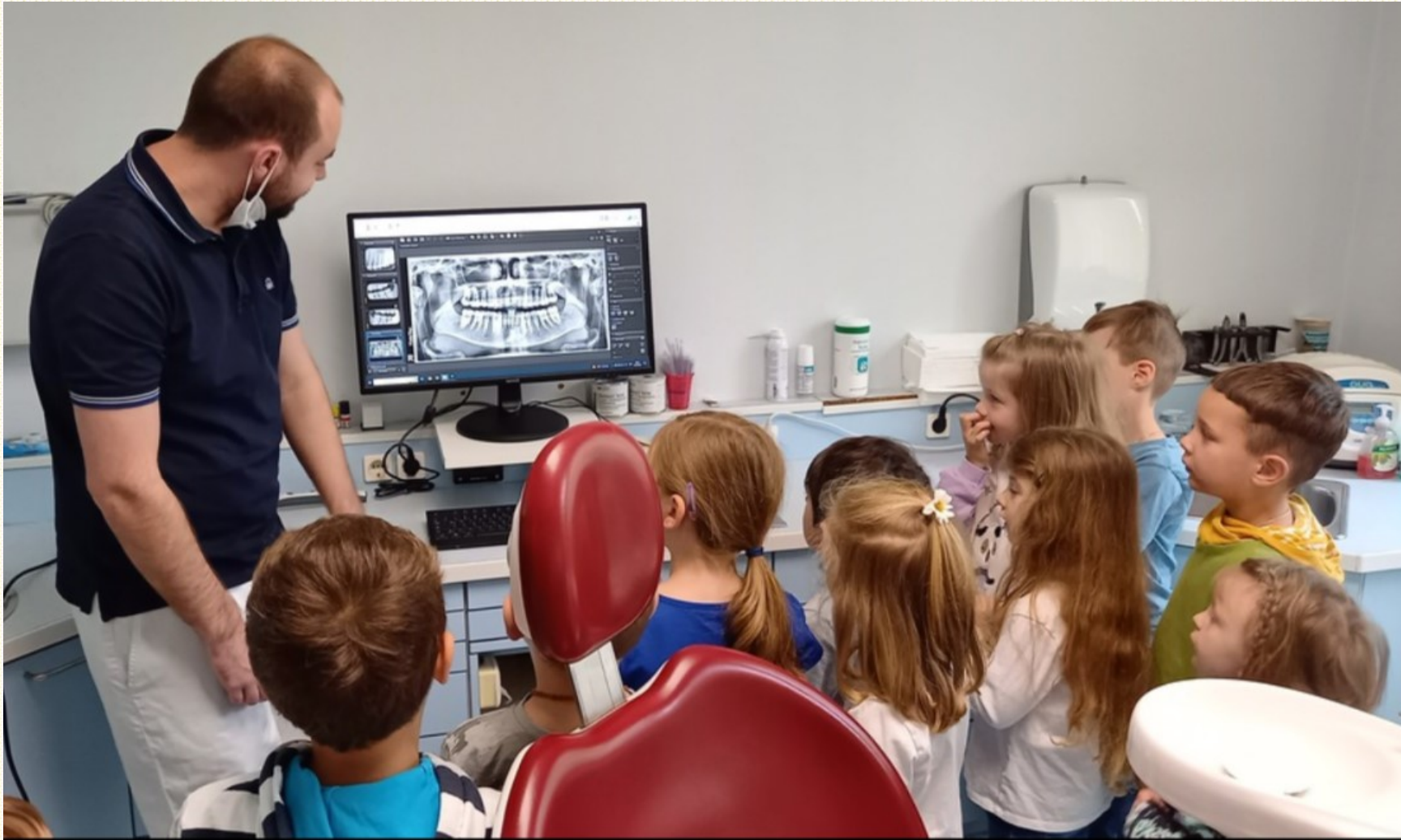
Ausgang zum Zahnarzt